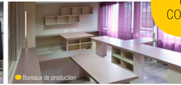
● Bureaux de production