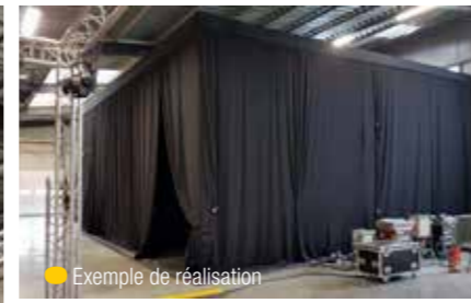
● Exemple de réalisation