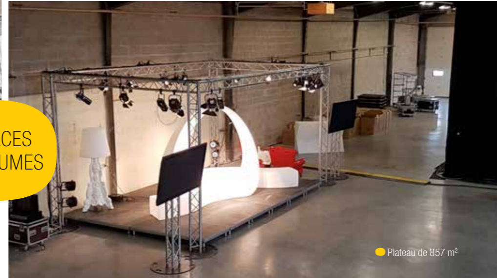
● Plateau de 857 m 2