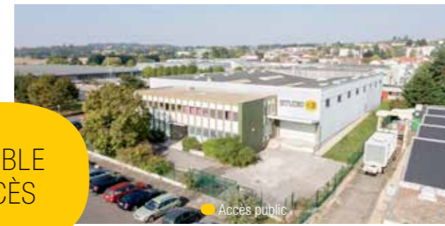
● Accès public