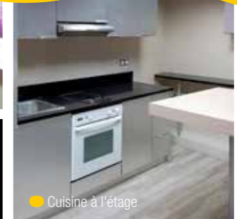
● Cuisine à l'étage